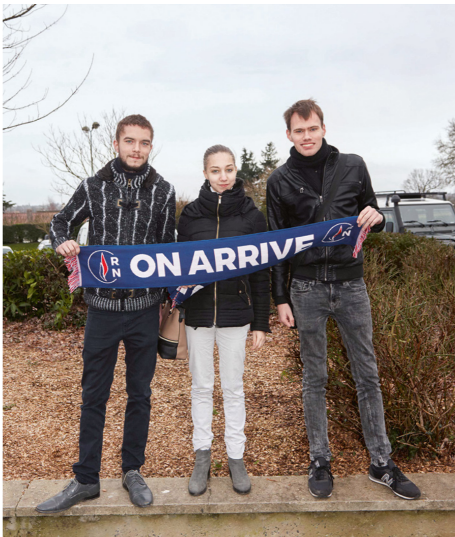
Cover: Mick de Lint @ Kathrin Hohberg Agency; Model: Jentje Zaal @ Max Models; Styling: Caroline Fuchs @ House of Orange Agency; Make up: Celine Bernaerts @ House of Orange Agency; Hair: Cynthia Schippers @ House of Orange Agency; Titelillustration: Ryan Evans; Fotos: Stephanie Füssenich, privat; Illustrationen: Tanja Laböck, Nicholas Keays