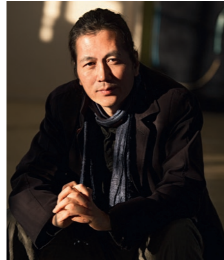
Byung-Chul Han verteidigt die Freiheit S.34