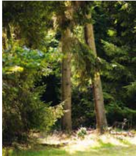
Das Geheimnis der Bäume S.42