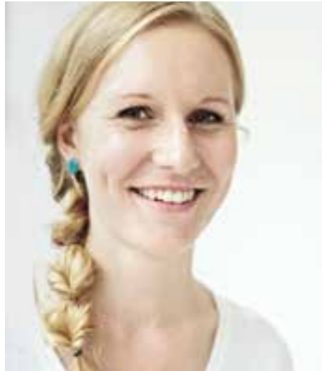
Die andere Seite der Krankheit S.52