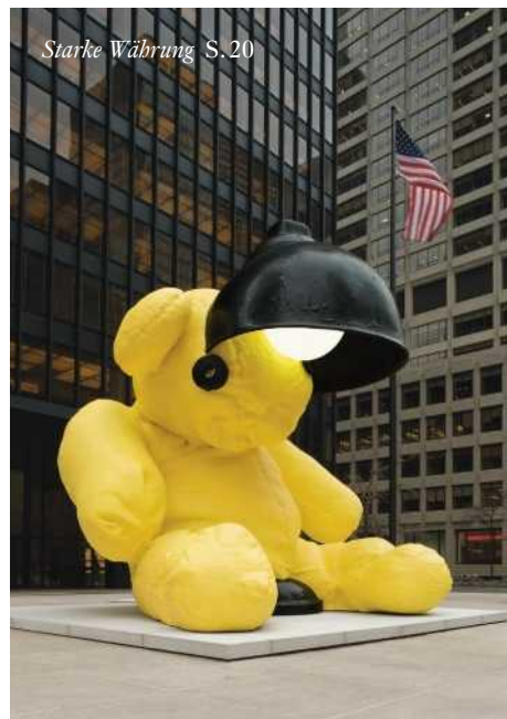
Starke Währung S.20