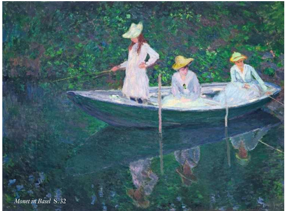
Monet in Basel S.32